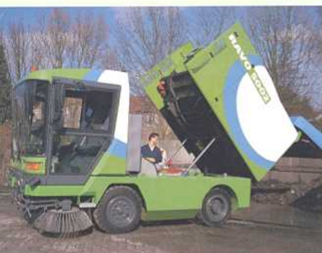
Type ST met tippende container