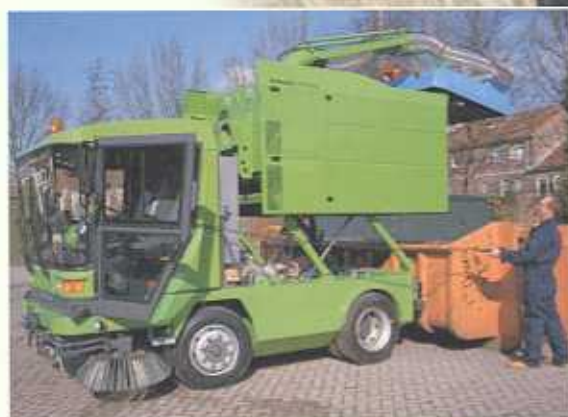
Type CD, dumpen op 1,5 m