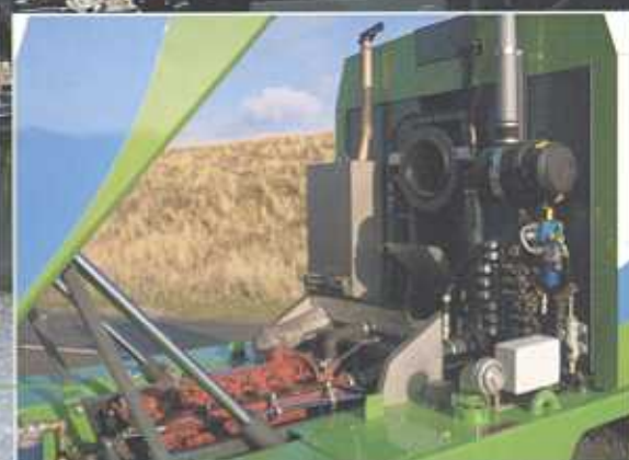
Makkelijk toegankelijk motorcompartment